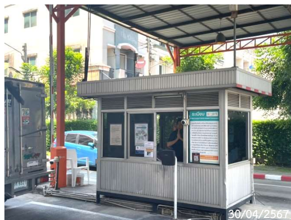
รูปที่ 2-12 เจ้าหน้าที่อำนวยความสะดวกด้านจราจรบริเวณทางเข้า-ออกพื้นที่โครงการ