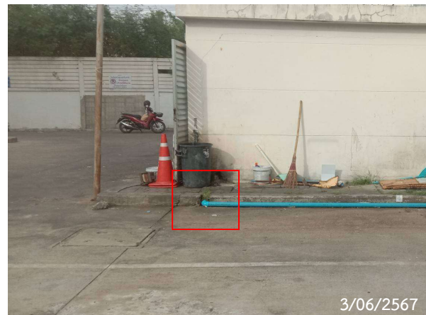
รูปที่ 2-20 ท่อระบายน้ำเสียห้องขยะมูลฝอย