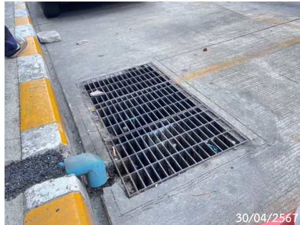
รูปที่ 2-24 บ่อหน่วงน้ำ