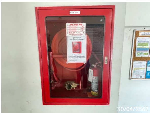
ตู้สายฉีดน้ำดับเพลิง (Fire Hose Cabinet : FHC)