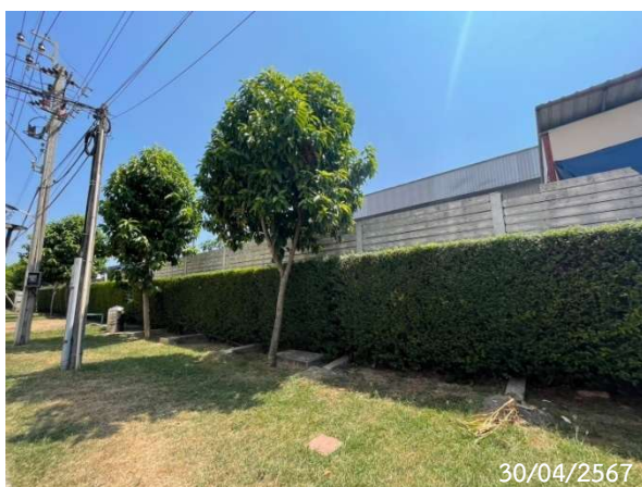
รูปที่ 2-31 แนวเขตที่ดินด้านติดกับคลองตาสอน