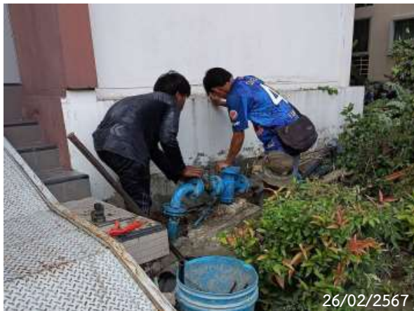
รูปที่ 2-16 เจ้าหน้าที่ตรวจสอบเส้นท่อประปา