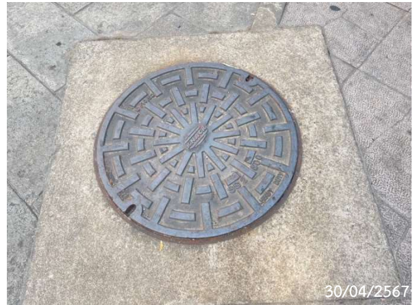
รูปที่ 2-11 ระบบบำบัดน้ำเสีย