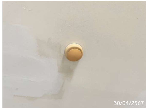
เครื่องตรวจจับควัน (Smoke Detector)