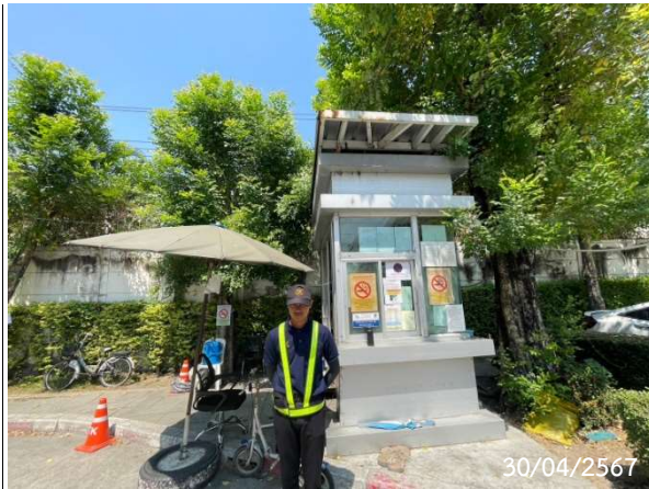
รูปที่ 2-10 เจ้าหน้าที่รักษาความปลอดภัย และอำนวยความสะดวกด้านจราจรภายในโครงการ