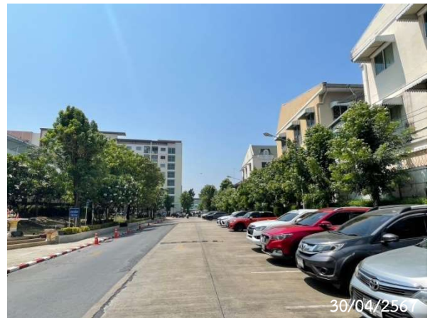
รูปที่ 2-33 สภาพแวดล้อมโครงการ