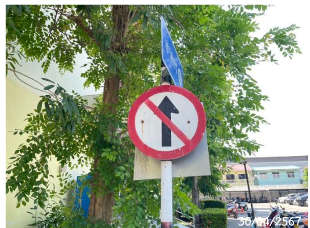
รูปที่ 2-13 สัญลักษณ์และป้ายจราจรภายในโครงการ