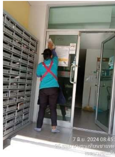
รูปที่ 2-29 พนักงานทำความสะอาดภายในอาคาร