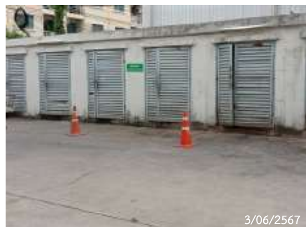
รูปที่ 2-19 ห้องพักรับมูลฝอยรวม