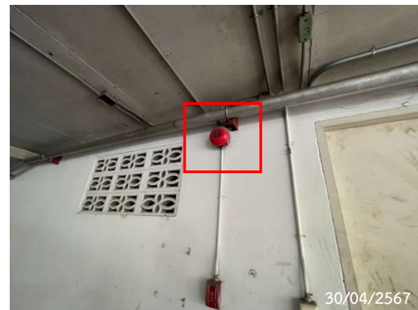
อุปกรณ์แจ้งเหตุด้วยมือ