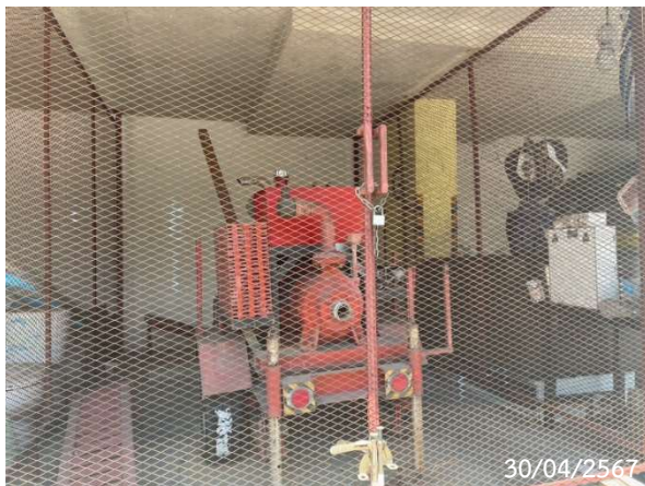
เครื่องสูบน้ำดับเพลิง