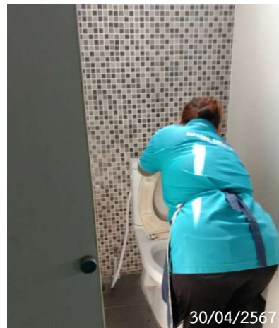
รูปที่ 2-30 พนักงานทำความสะอาดห้องสุขา