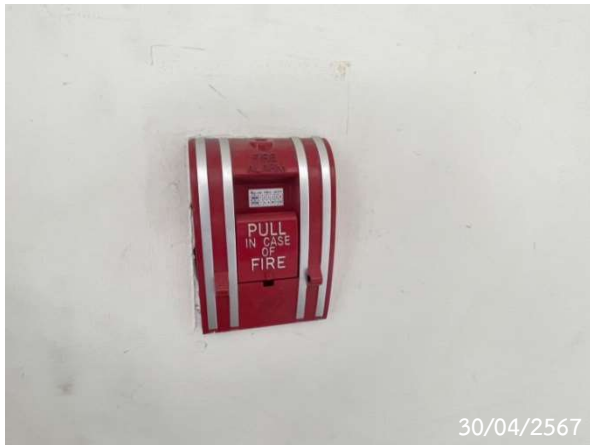
กริ่งสัญญาณเตือนภัย (Alarm bell)