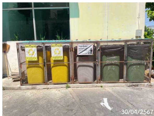
รูปที่ 2-18 ภาชนะรองรับมูลฝอย