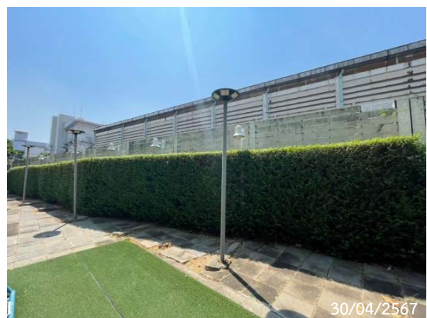
รูปที่ 2-32 แนวเขตที่ดินด้านติดกับคลองบางสีบาท