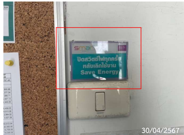
รูปที่ 2-17 ป้ายรณรงค์การประหยัดพลังงาน