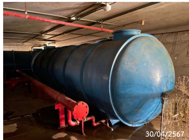
ถังสำรองน้ำดับเพลิง