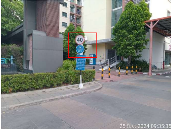
รูปที่ 2-8 ป้ายจำกัดความเร็ว