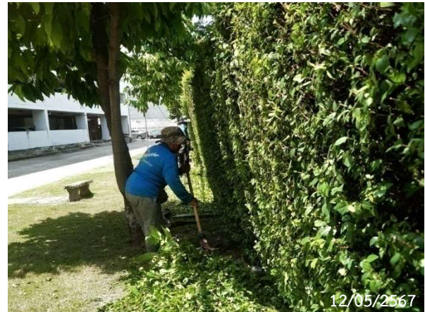
รูปที่ 2-3 เจ้าหน้าที่ดูแลพื้นที่สีเขียว