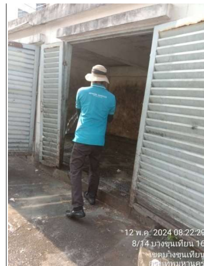
รูปที่ 2-21 พนักงานทำความสะอาดจุดพักขยะ