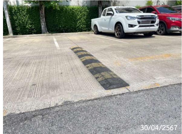
รูปที่ 2-9 สันนูนชะลอความเร็ว